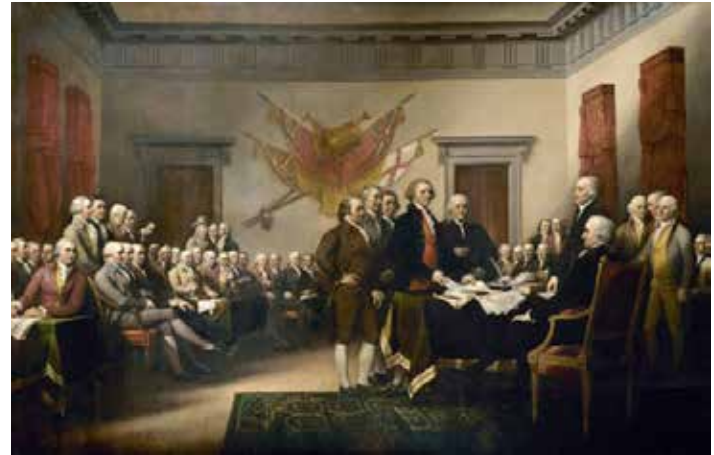
Firma de la Declaración de Independencia de los EEUU. 1776.

El precedente de la Revolución francesa lo encontramos en la independencia de los Estados Unidos (1775-1783) . Por primera vez un territorio colonial (las trece colonias inglesas en América del Norte) se independiza y, tras una guerra, crea un modelo de Estado basado en ideas del pensamiento ilustrado: soberanía nacional, división de poderes, sufragio. Todo ello recogido en la Constitución de 1787. La independencia americana fue un modelo para la Revolución francesa y para los países americanos que se independizaron posteriormente.