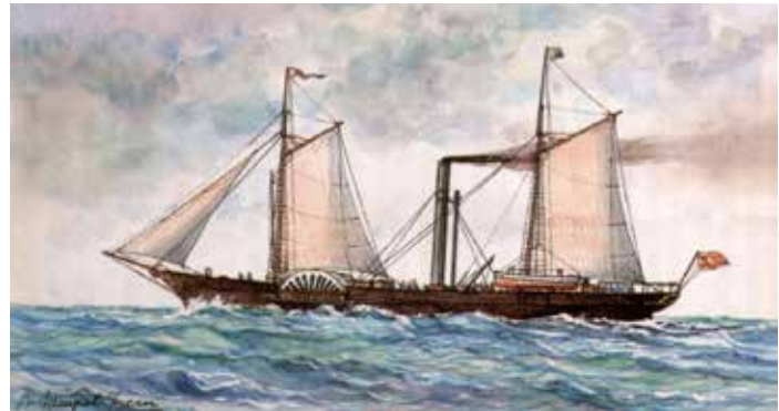
El barco a vapor, junto con el ferrocarril, se convirtieron en los dos grandes avances de los medios de transporte durante la Primera Revolución Industrial.

La Revolución Industrial provocó la primera globalización , que permitió ampliar el marco de las relaciones económicas, cada vez más extendidas por el planeta, y cambiar el marco de las relaciones sociales, ya que cada vez será más sencillo, rápido y económico el desplazamiento de las personas de unos lugares a otros del planeta. Los desplazados buscaban casi siempre mejorar las condiciones de vida que les ofrecía el mundo caduco del Antiguo Régimen, aunque no siempre lo consiguieron en la nueva sociedad del “capitalismo” .