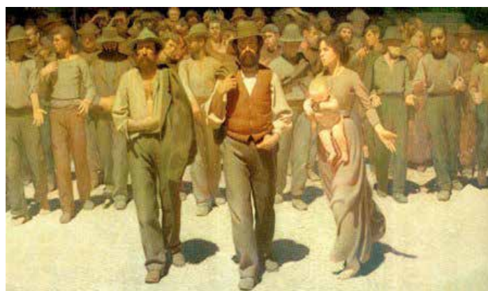
Una de las consecuencias de la Revolución Industrial fue la aparición del proletariado.