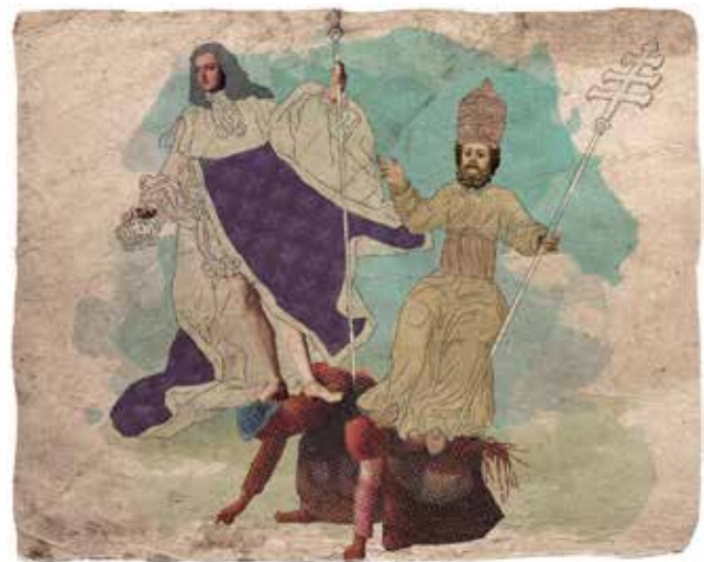
El tercer estado es oprimido y explotado por los estamentos privilegiados.

A lo largo de la segunda mitad del siglo XVIII los grupos no privilegiados (la burguesía principalmente) reclamaron mayor igualdad , a lo que se negaron los sectores privilegiados (la nobleza y el clero). Ello dio lugar a una gran conflictividad social que tuvo su primer gran hito con la Revolución francesa (1789-1814).