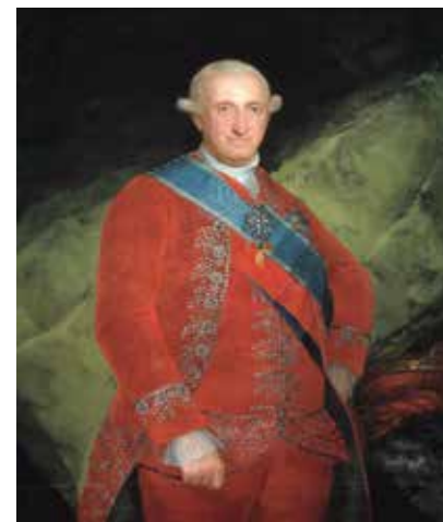
Carlos IV (1748-1819)

En 1807 la Francia de Napoleón y España firmaron el Tratado de Fontainebleau , por el que Napoleón conquistaría Portugal cruzando España. La presencia de los ejércitos franceses en España provocó el motín de Aranjuez (1808), instigado por el hijo de Carlos IV, Fernando VII, que ocasionó la renuncia del monarca. Ante esta situación, Napoleón retuvo en Bayona (ciudad francesa) a Carlos IV y a Fernando VII y nombró rey de España a su hermano José I. El pueblo español reaccionó con levantamientos populares en numerosas ciudades (la primera, Madrid el 2 de mayo de 1808) que desembocaron en la guerra de Independencia, cuya característica principal fue ser una “guerra de guerrillas”. La situación del emperador francés en Europa le obligó a retirar sus tropas de España y a firmar el Tratado de Valençay (1813), finalizando el conflicto y dando la corona a Fernando VII, que iniciará un nuevo periodo a partir de 1814.